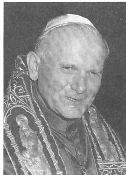
Joannes Paulus PP. II