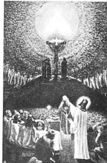
ZMARTWYCHWSTANIE PAŃSKIE. KONTYNUACJA W KOŚCIELU. Z poświęcenia kamienia węgielnego pod kaplicę w Marly 26 go czerwca 1966.